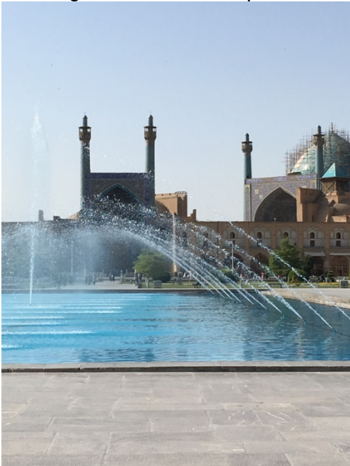
Ultimo giro in Piazza Naqsh-e Jahan